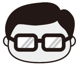
マスコットキャラクター 岩沼係長