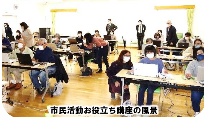
市民活動お役立ち講座の風景