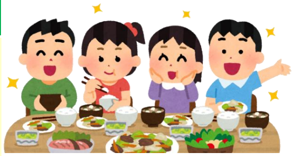
きょうしよく ※共食…誰かと一緒に食事をする。

岩沼の子ども食堂は、子どもだけでなく、高齢者や子育てで忙しい方など大人も利用することができる所も多くあります。