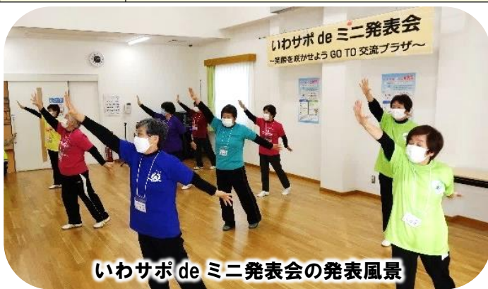
いわサポ de ミニ発表会の発表風景