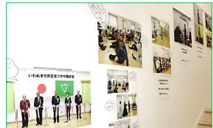
※2周年のあゆみ写真展の様子

利用者の皆さんに愛され続けてはや5年。 登録団体の活動を紹介するパネル展と開館からの 5年間のあゆみ写真展を開催します。 ぜひ、ご覧ください。