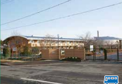
【最寄りの停留所】 岩沼高等学園正門前