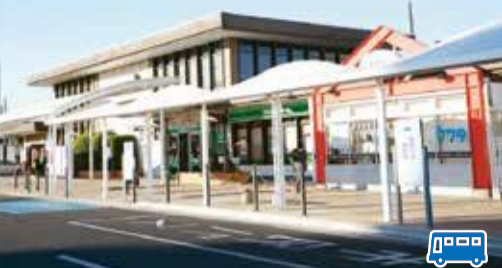
【最寄りの停留所】 岩沼駅東口